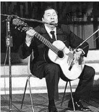
El cantautor argentino Atahualpa Yupanqui .

La canción popular o canción moderna es el tipo de canción más escuchada en el mundo actual, y es transmitida a través de grabaciones y medios de comunicación a grandes audiencias por todo el mundo. Tomó forma en las ciudades europeas y americanas en los siglos XIX y XX, con origen tanto en las canciones de la música erudita como en las canciones folclóricas de diversas culturas. La voz es usualmente acompañada en ejecución y grabación por un grupo musical . No son creaciones anónimas, tienen autores conocidos, que pueden grabar e interpretar ellos mismos las canciones o trabajar para otros artistas que las incorporarán a su repertorio. Con frecuencia, pero no siempre, sus