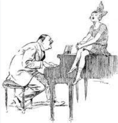
Caricatura que muestra el ensayo de una canción.

En ocasiones, aunque es incorrecto, la palabra canción es usada coloquialmente para referirse a cualquier composición musical no muy extensa, incluyendo aquellas sin canto, de carácter instrumental. 3 En la música clásica europea y en la música en general, «canción» solo debe ser usado para describir una composición para la voz humana, salvo en algunas excepciones, como por ejemplo las canciones sin palabras del periodo romántico, piezas escritas por compositores como Mendelssohn o Chaikovski que no son para voz humana, sino para algún instrumento (normalmente piano), y aun así son consideradas canciones