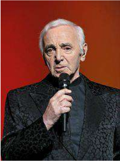
El cantautor francés Charles Aznavour .