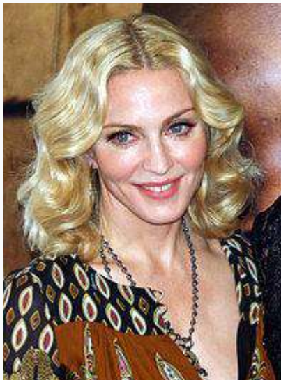
Madonna , artista estadounidense de canción pop.