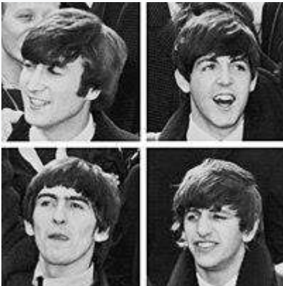
El grupo inglés The Beatles .