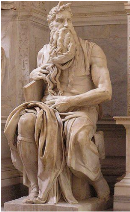
"Moisés" y su autor es Miguel Ángel Buonarrotti

MATERIALES: arcilla, plastilina, jabón rey, papel mache, porcelanicon, etc.